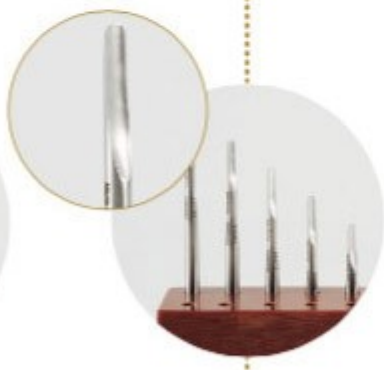
Narrow luxator set 13/64 inch (4 mm)