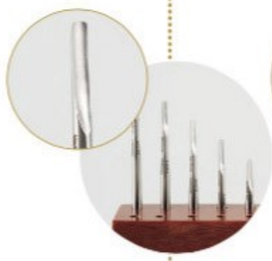
Wide luxator set 5/32 inch (5 mm)